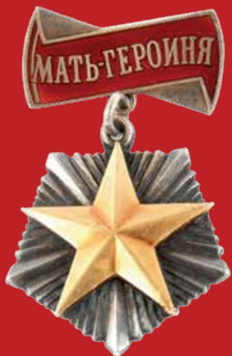
Орден «Мать-героиня» (СССР)