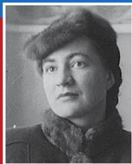
Нина Николаевна Ватолина

Автор этого плаката Нина Николаевна Ватолина — российская художница- живописец, график, литератор