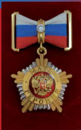
Орден «Мать-героиня» (современный)

чуть более 430 тысяч представительниц лучшей половины человечества. Большинство из них проживали в районах Казахстана и Средней Азии.